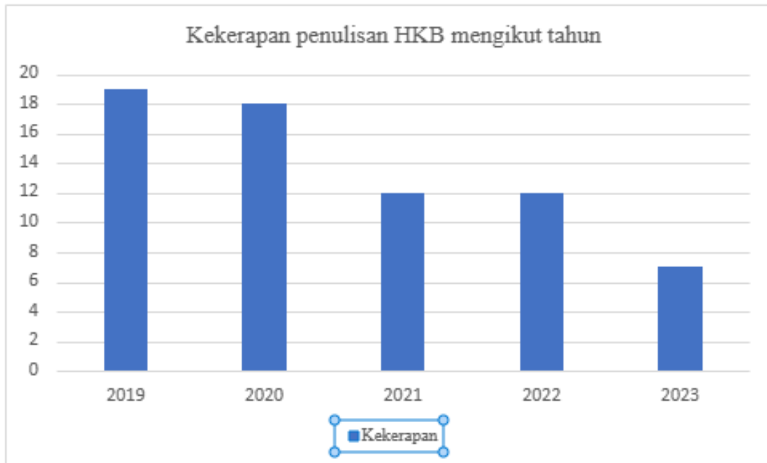
Rajah 2: Kekekapan penulisan HKB mengikut tahun

Jadual 1 menunjukkan senarai tajuk artikel, nama pengarang dan tahun penerbitan. Melalui senarai ini, penulis telah mengenalpasti sebanyak 12 tema yang berkaitan HKB iaitu; (1) Antarabangsa, (2) Dialog dan toleransi beragama, (3) Hak asasi manusia, (4) Hak penyebaran agama bukan Islam, ajaran dan ideologi asing, (5) Hak penyebaran agama Islam, (6) Kalimah Allah, (7) Kebebasan melakukan dosa dan menghina Islam, (8) Keluar masuk Islam, (9) Kenegaraan, (10) Kritik insittusi agama Islam, (11) Pemeliharaan tradisi Islam dan (12) Politik.