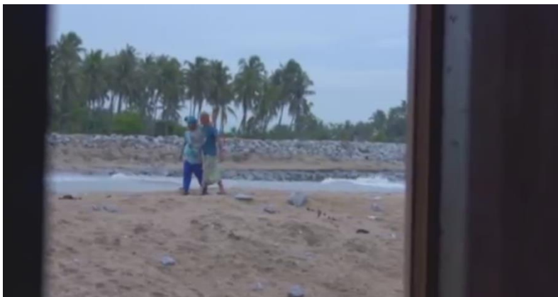
Gambar 3.1 Lokasi pantai dalam Cinta Kun Fayakun menunjukkan keindahan alam

Dalam drama ini, lokasi dan latar penggambaran yang digunakan adalah di negeri Kelantan dan Mesir. Antara lokasi yang menjadi pilihan pengarah adalah di tepi pantai, sungai dan kelas di institusi. Di Kelantan antara lokasi pilihan pengarah adalah kawasan pantai Cahaya Bulan yang menempatkan rumah Nenek Rahman. Antara babak yang ditunjukkan adalah seperti di Gambar 3.1 apabila Rahman bertegur sapa dengan seorang lelaki yang sedang membawa jaring ikan. Secara tidak langsung Mior ingin menunjukkan ia merupakan antara punca rezeki penduduk di situ. Selain itu, kegemaran Hanum yang suka meluangkan masa di tepi pantai dan beberapa syot laut, ombak, langit dan babak yang menunjukkan Rahman, Hanum dan Fatimah yang berjalan di tepi sungai di Mesir adalah cara Mior ingin menunjukkan kekuasaan dan keindahan ciptaan Allah untuk direnungi oleh penonton.