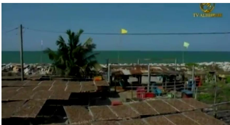
Gambar 3.4 Lokasi tepi pantai dan perusahaan keropok kering sebagai tradisi makanan rakyat Kelantan (ep.7)

Dalam drama ini, latar lokasi yang dipilih adalah di Kelantan, Putrajaya dan Kemboja. Beberapa simbol telah ditunjukkan oleh Mior dalam beberapa babak sebagai mewakili lokasi tersebut. Contohnya, Putrajaya diwakili oleh wide syot bangunan-bangunan kerajaan di Putrajaya dan jambatan Putrajaya. Manakala di Kelantan pula, Mior menunjukkan simbol yang mewakili Kelantan seperti wide syot lapangan Terbang Kota Bharu, kawasan perusahaan keropok ikan seperti yang ditunjukkan di Gambar 3.4, sekolah pondok, dan sebagainya. Di Kemboja pula, Mior menunjukkan pengenalan negara tersebut dengan wide syot lapangan terbang, pasar di Kemboja, Kampung Chnnang, Tugu Kemerdekaan Kemboja, Istana Kerajaan Kemboja dan kesibukan jalanraya di Kemboja.