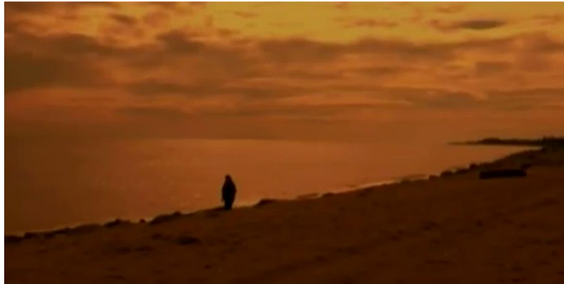
Gambar 3.3 Wardah yang berjalan di tepi pantai menampakkan keindahan alam dan kekuasaan Allah(ep. 11)

Selain itu, keindahan laut, pantai, langit turut menjadi latar bagi drama ini. Kebanyakan babak sedih yang dihadapi oleh Wardah seperti di Gambar 3.3, Mior memilih lokasi tepi pantai dan laut sebagai ekspresi untuk menunjukkan seseorang yang sedang bersedih ingin mencari ketenangan dengan merenung kuasa Allah S.W.T seperti yang disarankan dalam al-Quran. Contohnya beberapa babak dan syot rakaman di episod 3,4,5, 6, dan 10, Wardah berjalan di tepi laut dan duduk di atas batu merenung ombak pantai di tepi laut . Lokasi tepi pantai ini juga dipilih Mior ketika Tasnim memeluk Wardah selepas Tasnim membaca Warkah Cinta daripada Amir yang bertujuan untuk Wardah tidak menghubunginya lagi seperti di episod 1 dan episod 10.