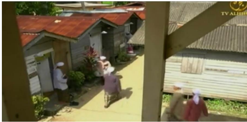
Gambar 3.5 Lokasi Pondok dan Pelajar Pondok menunjukkan kehidupan zuhud umat Islam (ep. 4)